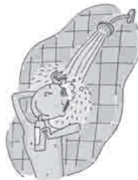
Lucas / 10h00