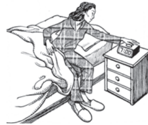
Salima / 7h00