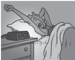
Sonya / 8h00