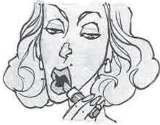
Nathalie / 8h15