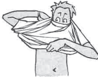
Pascal / 7h30