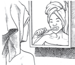
Mai / 6h45